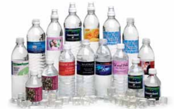
Water Bottle Labels!

A LX810 imprime em diferentes materiais para rótulos e etiquetas, incluindo rótulos inkjet high-gloss, semi-gloss e matte. Os rótulos impressos em material high-gloss são altamente resistentes a riscos e manchas e à prova-de-água.