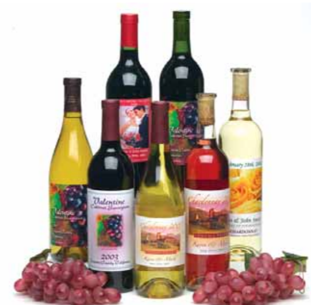
Wine Bottle Labels!

A LX810 produz rótulos vistosos de qualidade profissional para todos os seus produtos. É também perfeita como anfitriã para outras utilizações, como: testes antes de imprimir trabalhos em maiores quantidades. Testes de marketing. Fabrico de contratos. Rotulagem privada. Rótulos promocionais. Rótulos a cores para caixas, com os códigos de barras requeridos. E muito mais!